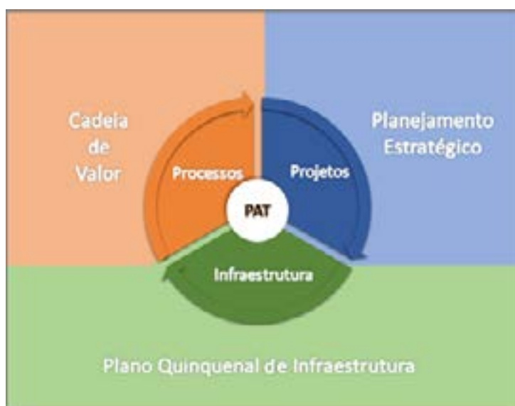
Figura 6.2 - Componentes do Plano Anual de Trabalho

tucionais, devendo ser associadas a um processo de negócio, que é o desdobramento de um macroprocesso da Cadeia de Valor.