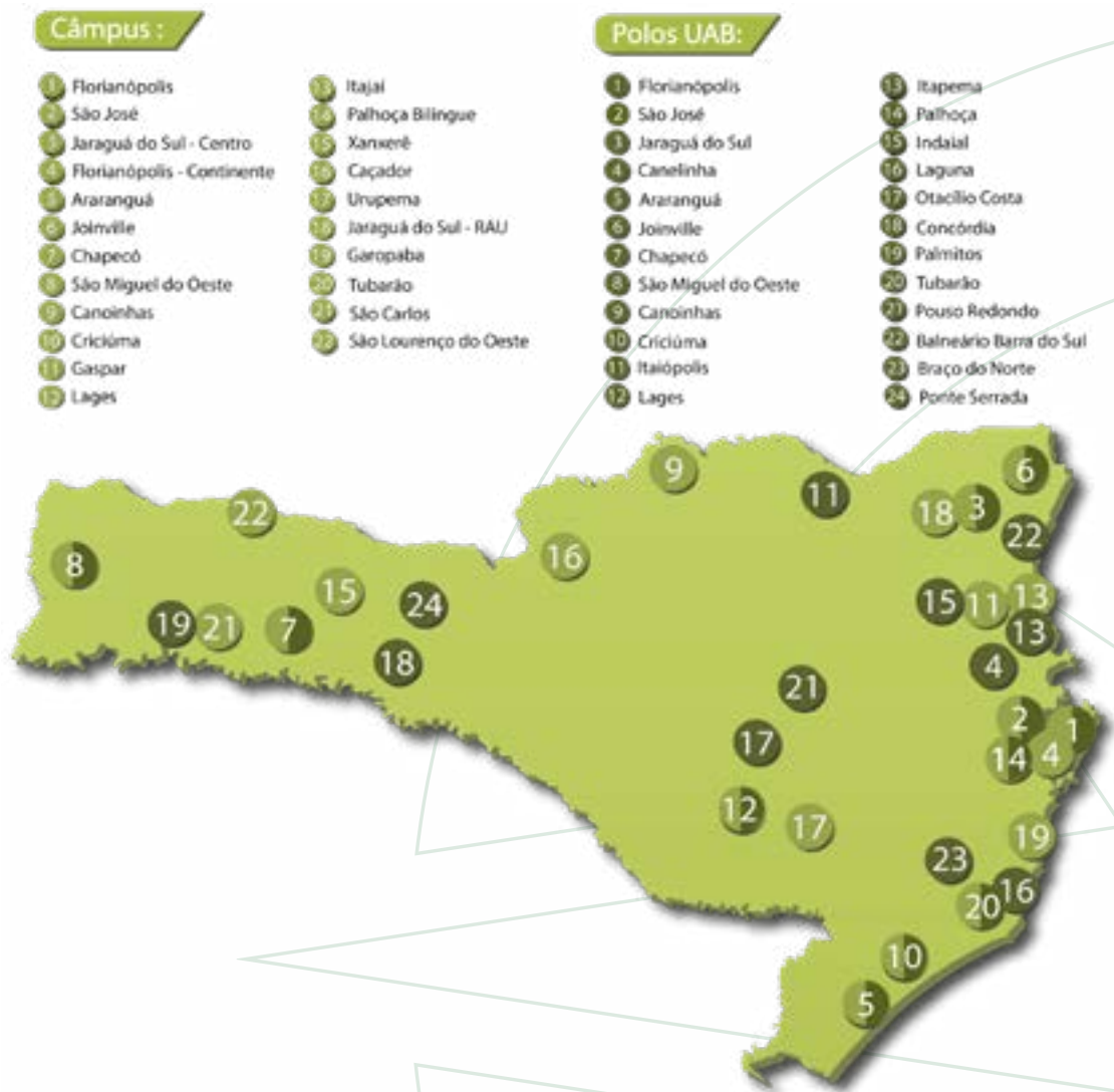
Figura 4.12. - Núcleos de Educação a Distância (NEADs) e Polos UAB.

Através da articulação entre seus diversos câmpus, o IFSC ofertará mais de 3.000 novas vagas, com recursos da CAPES/UAB, em 16 cursos superiores de tecnologia, licenciaturas e especializações, com foco na formação de professores e agentes públicos, na vigência do PDI 2025-2029 (Figura 4.4.)