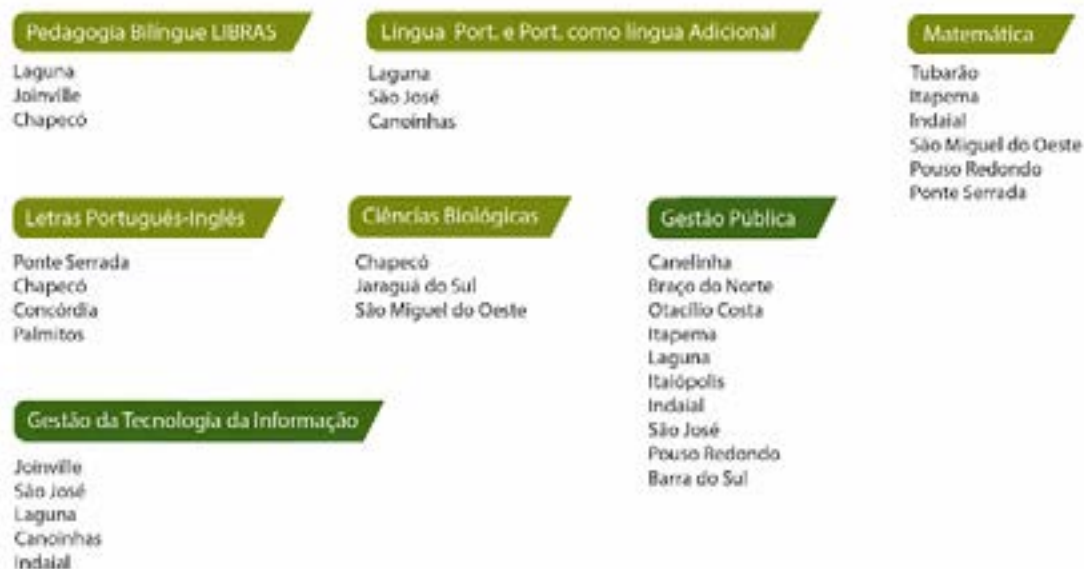
Figura 4.13. - Polos com ofertas resultantes de fomento externo 2025-2029.