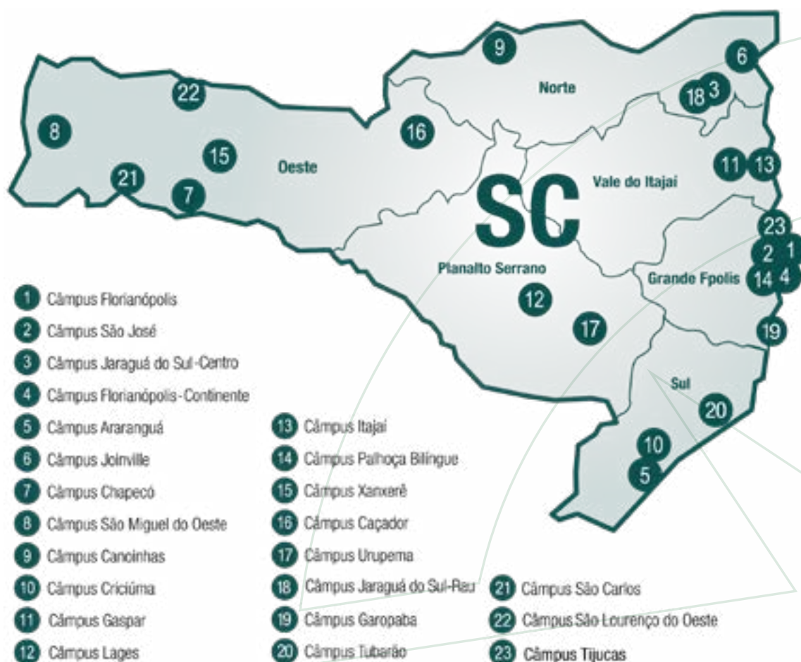
Figura 1.1. Distribuição dos câmpus do IFSC no mapa de Santa Catarina.