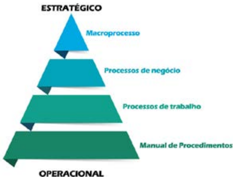
Figura 1.3. Relação entre os níveis de detalhamento do mapeamento.

A linguagem de mapeamento padrão do IFSC possui quatro níveis de detalhamento. Cada nível possui seu conjunto específico de dimensões mapeadas, um público-alvo e um propósito. Os níveis estão ligados entre si por uma relação de desdobramento, ou seja, níveis mais detalhados são oriundos de níveis menos detalhados e níveis menos detalhados são agregações de níveis mais detalhados. Os níveis são os que seguem, conforme Figura 1.3, do mais agregado para o mais detalhado.