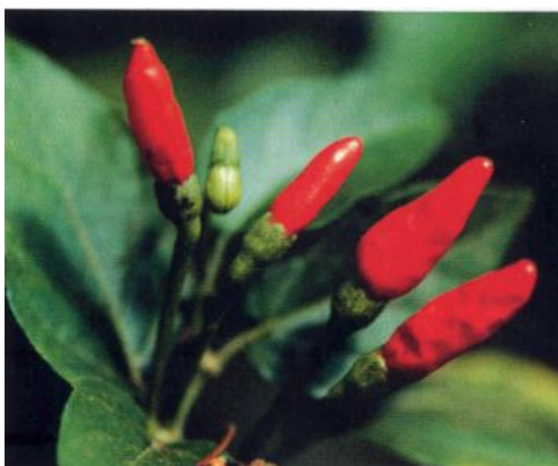
Figura 3. Pimenta Malagueta.