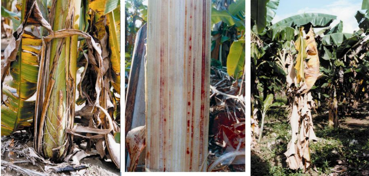
Figura 5. (a) Rachaduras; (b) Descoloração; (c) Amarelamento