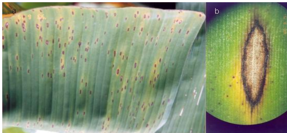
Figura 2. Planta com Sigatoka-amarela.