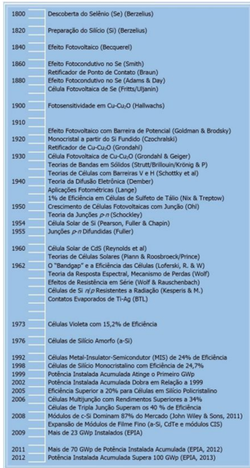
F1: Principais ocasiões no desenvolvimento da célula fotovoltaica,(PINHO e GALDINO,2014).

A Figura 1, mostra as principais ocasiões que marcam o desenvolvimento da célula fotovoltaica até o ano de 2012.