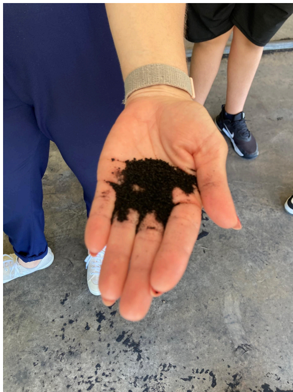
Figura 3 - Resíduo do processo de limpeza da empresa 2.