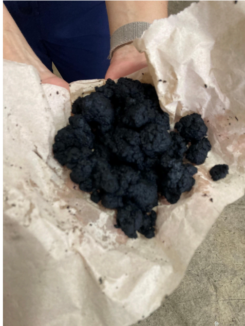
Figura 2 - Resíduo do processo de limpeza da empresa 2.

Na Figura 2 é possível observar o resíduo do processo de limpeza biológica antes de passar pelo processo de ressecamento.