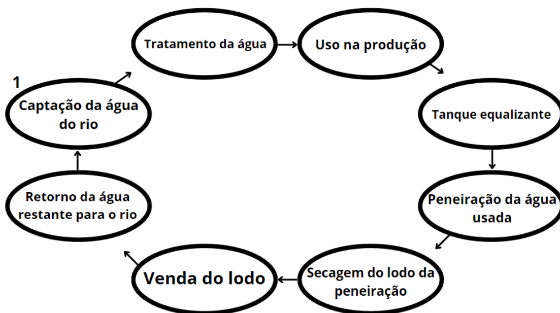
Figura 1 - Processo de tratamento de água da empresa 1 e da empresa 2.