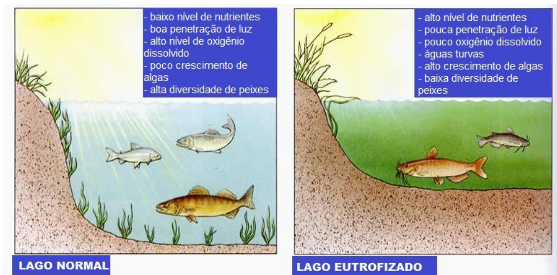
Anexo 1: Esquema de eutrofização. Fonte: adaptado Langanke, apud Raven, P. H.; Berg. L. R.; Johnson, G. B. 1998.