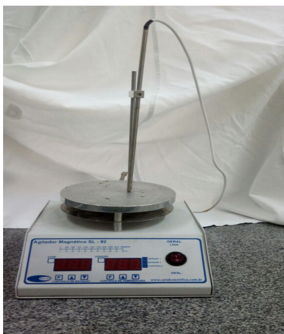
Figura 2: Chapa de aquecimento.

Para análise de resíduo de evaporação foi pesado um béquer de 600 mL em uma balança analítica e anotado seu peso. Adicionou-se 100 mL de analito (água), em seguida foi colocado em uma chapa de aquecimento (FIGURA 2) a 120^{\circ}C até a total evaporação do líquido. Depois da evaporação o béquer foi novamente pesado em uma balança analítica, e a diferença do peso inicial para o final em mg/L, indicou o resíduo de evaporação calculado ou resíduo seco (DNPM, 2004). Depois os valores foram comparados às informações contidas no rótulo, para verificar divergências.