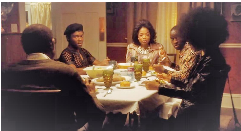
Imagem 4 – Cena de “O mordomo da casa branca” em que dois membros do BPP aparecem (a esquerda de boina e a primeira à direita)

Mesmo após o fim da escravidão, o preconceito aos negros continua a ser praticado através de ideias, atitudes e leis separatistas como a segregação, que foi legalizada pela Suprema Corte em 1896. Ela ergueu um “muro” entre negros e brancos, criando áreas separadas para ambos em locais públicos como restaurantes, banheiros, escolas e ônibus, caracterizando os negros como inferiores aos brancos. As revoltas que ocorriam quando indivíduos quebravam essa lei e a luta dos negros por direitos iguais e pelo fim da segregação racial podem ser observadas no filme “The Butler” (O mordomo da casa branca), 2013. Após muito tempo, tendo a segregação racial protegida por lei, o congresso, “pressionado pela participação da sociedade civil [...] aprovou em 1964 o Civil Rights Act (Lei dos Direitos Civis) que além de banir todo o tipo de discriminação; concedeu ao governo federal poderes para implementar a dessegregação” (OLIVEN, 2007, p.33). (imagem 4).