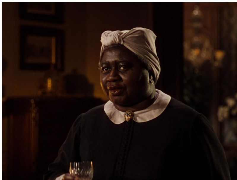
Imagem 6 – Representação de Mammy no filme “E o vento levou”