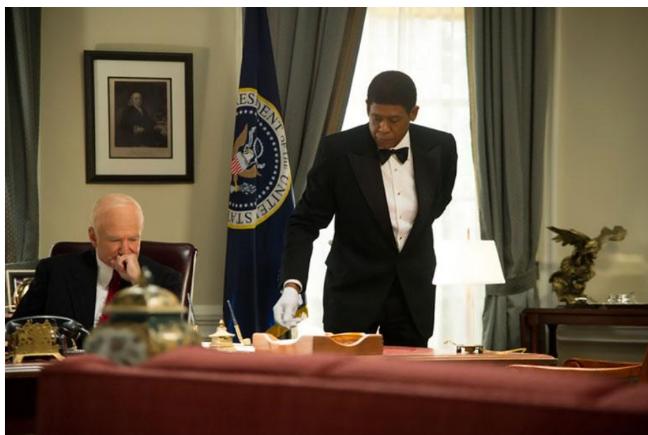
Imagem 5 – Empregado servil no fillme “O mordomo da casa branca”

(imagem 5). O negro ingênuo pode ser representado como o palhaço inofensivo ou o filósofo simplório e simpático.