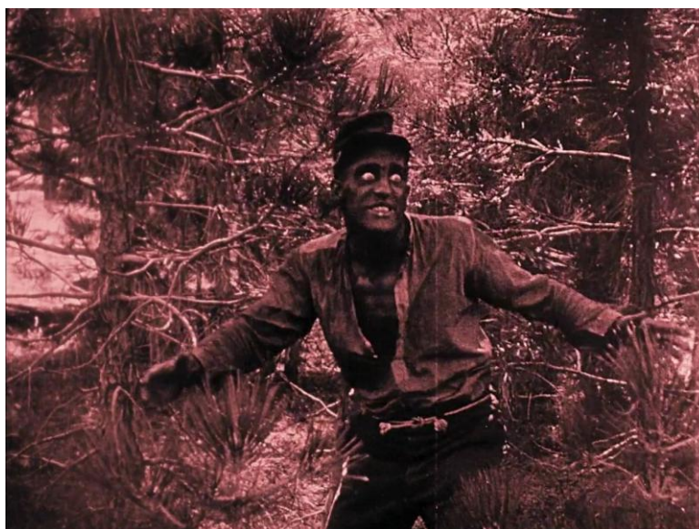
Imagem 7 – Negro brutal no filme “O nascimento de uma nação”