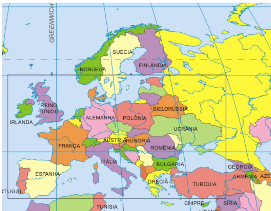
Imagem 1 - Meridiano de Greenwich