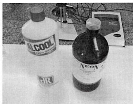
(Figura 1- Pote de plástico esterilizado e materiais para a limpeza.)