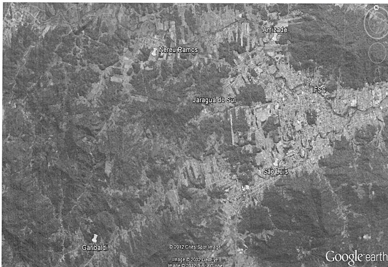
(Figura 2 – Mapa de Jaraguá do Sul e a localização dos pontos de coleta – Google Earth)

Para a análise das amostras foi utilizado um pHmetro da MsTecpom. Após sua calibração (conforme o manual e com a ajuda de técnicos responsáveis), o eletrodo era lavado com água destilada e submerso na amostra, quando a leitura do pH estabilizava (por volta de 20 minutos), era registrado o valor do pH e a temperatura (com um termômetro direto do pHmetro). Após os registros, o eletrodo era lavado novamente com água destilada e o pHmetro desligado. Foram coletadas e analisadas onze amostras e os resultados colocados na tabela abaixo: