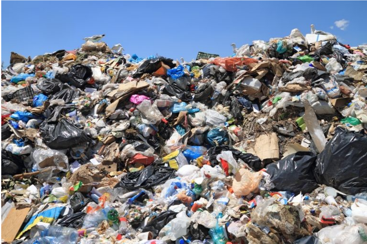
Figura 03: Lixão com vários resíduos plásticos.

Os resíduos poliméricos pós-consumo se destacam nos resíduos sólidos domiciliares (RSD), pois tem grande participação na composição do lixo urbano (MATOS, 2007).