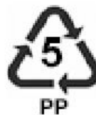
Símbolo de reciclagem