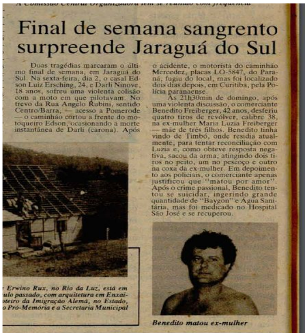
Figura 5 - Notícia 4 Final de semana sangrento surpreende Jaraguá do Sul