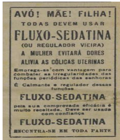
Figura 1 - Exemplo de um anúncio com a busca da palavra “mulher”